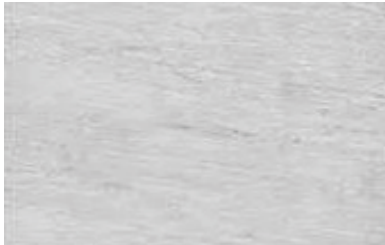
Vt0114 Stone grey mat 40x80 A R10 / A P 127

Natuur getrouw, heeft Dutch Design Tegels de natuursteen verbeterd in een keramische natuursteentegel. Met als doel een krasvaste, onderhoudsvriendelijke maar vooral een natuur getrouwe wand of vloer te maken