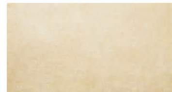
Vt0123 Marble sand mat 30x60 A R10 / A P 125