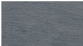
Vt0122 Marble black mat 30x60 A R10 / A P 125