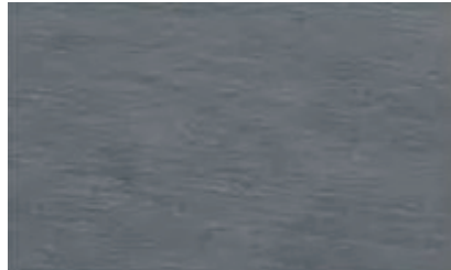
Vt0115 Stone black mat 40x80 A R10 / A P 127